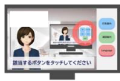
「リモート案内システム」

来院された患者様からのお問い合わせを「AI コンシェルジュ」が対応いたします。24 時間 365 日 AI が自動で対応し、案内業務を大幅に削減します。