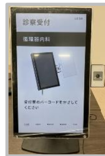
「診察受付システム」

患者様が受付票のバーコードをかざすだけで、診察受付を自動で行いスムーズな受付を支援します。